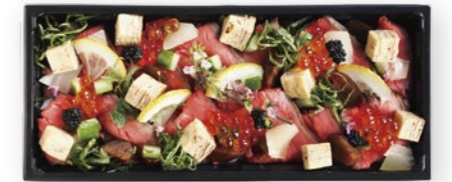
ローストビーフチラシ寿司