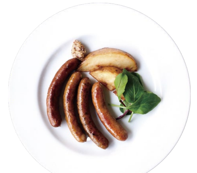
無添加ソーセージ各種