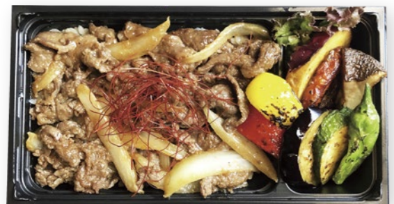
NO.3 はなが牛焼肉弁当