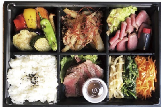
NO.1 ゆうぼくはりきり弁当