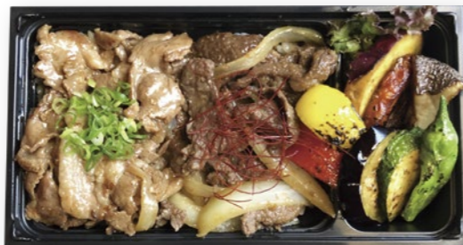
はなが牛豚あいもり弁当 (生姜焼き & 焼肉)