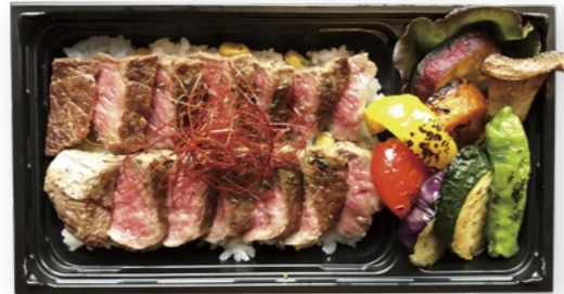
NO.2 ステーキライス弁当