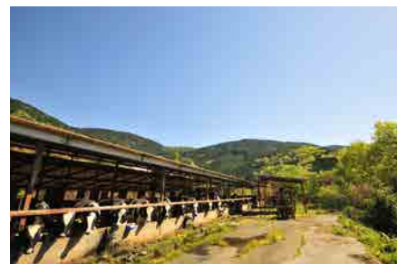
〔西予市の直営牧場〕 グループ全体で連携&チャレンジ