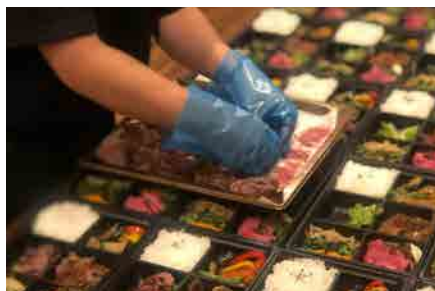
〔テイクアウト〕 コロナ禍でも有難いことです。