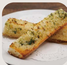
ガーリック トースト + ¥100