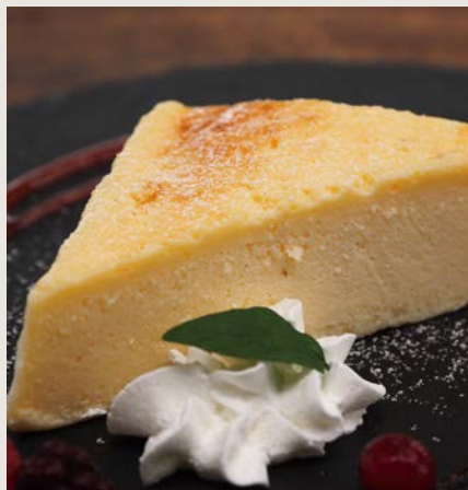
自家製チーズケーキ ¥450

濃厚なクリームチーズをたっぷり使用しました。お食事の後でも食べやすいよう甘さを抑えて作っています！