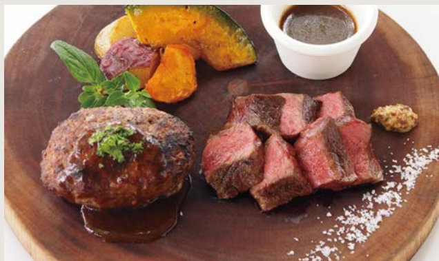
ステーキ&ハンバーグ ¥2300