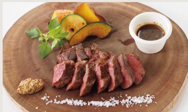
本日のステーキ お肉によって 異なります