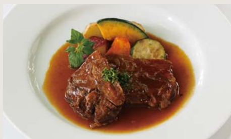
はなが牛ステーキビーフシチュー ¥1600

牛の骨やすじから出汁を取るところから始まり、 約3日間をかけて完成させるこだわりのシチュー。 「脂っこくなくあっさりしている」と好評です。