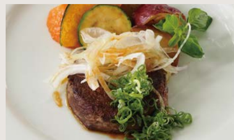
はなが牛ソフトステーキ ¥1400

丁寧に掃除した鶏ガラからブロードを取り、 数日の時間と手間をかけて作っています。 赤ワインと香味野菜の旨みと香りをご堪能ください。