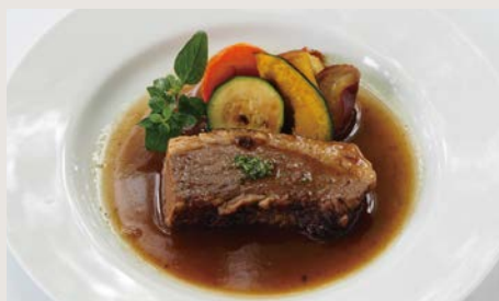
はなが牛赤ワイン煮 ¥1700

牛の骨やすじから出汁を取るところから始まり、 約3日間をかけて完成させるこだわりのシチュー。 「脂っこくなくあっさりしている」と好評です。