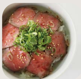
ローストビーフ ライス + ¥300