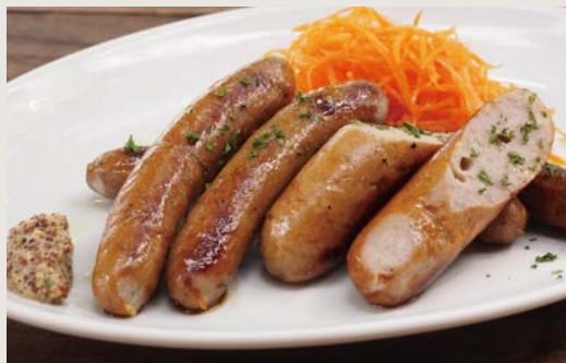
無添加ソーセージ盛り合わせ ¥800

ゆうぼく自家製の添加物を使わないソーセージを盛り合わせ。味付けの違う数種のおいしいソーセージ食べ比べられます。