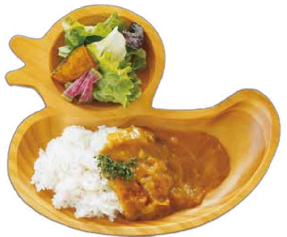
キッズカレープレート ¥700 ※アレルギー 28 品目等不使用