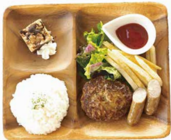
ゆうぼくキッズプレート ¥1,000